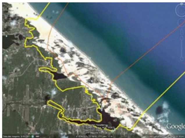
Figura 3: proposta de ampliação da RESEX da Prainha

es-peculadores imobiliários, desta vez de um protagonista que se dizia “amigo” da comuni-dade e possui uma mansão (veraneio) de 4 mil-hões de Reais (Revista VEJA – 17, Junho 2009) dentro da área delimitada pela reserva. O espe-culador, proprietário de uma rede de escolas e faculda-de no município de Fortaleza, entrou com uma ação de embargo contra a formação da RESEX da Prainha. Já perdeu em primeira instância e seu ato proporcionou uma vistoria do Grupo de Trabalho do Instituto Chico Mendes para Conservação da Biodiversidade (ICMBio), agência do governo federal respon-sável para cogestão da RESEX da Prainha do Canto Verde. O rela-tório já foi aprovado pelo Presidente do ICMBio e foi proposta uma ampli-ção da área da RESEX (Figura 3).