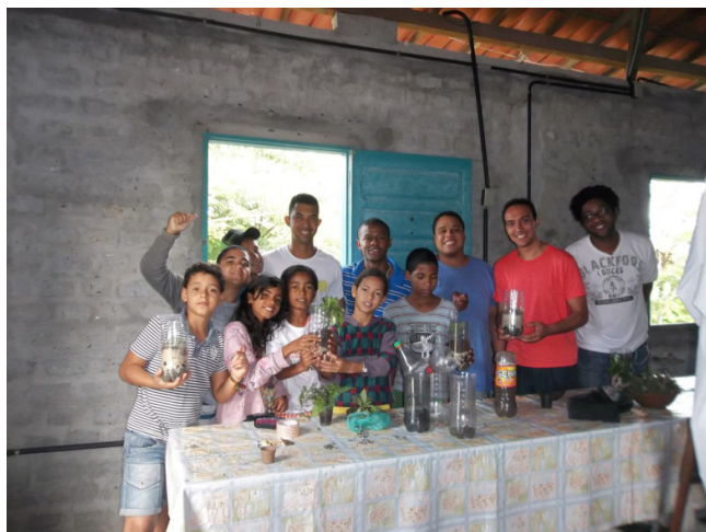
FIGURA 4 – VIVÊNCIAS ENTRE OFICINEIROS E ESTUDANTES.

Foto: João Paulo Silva, 10 de julho de 2015.