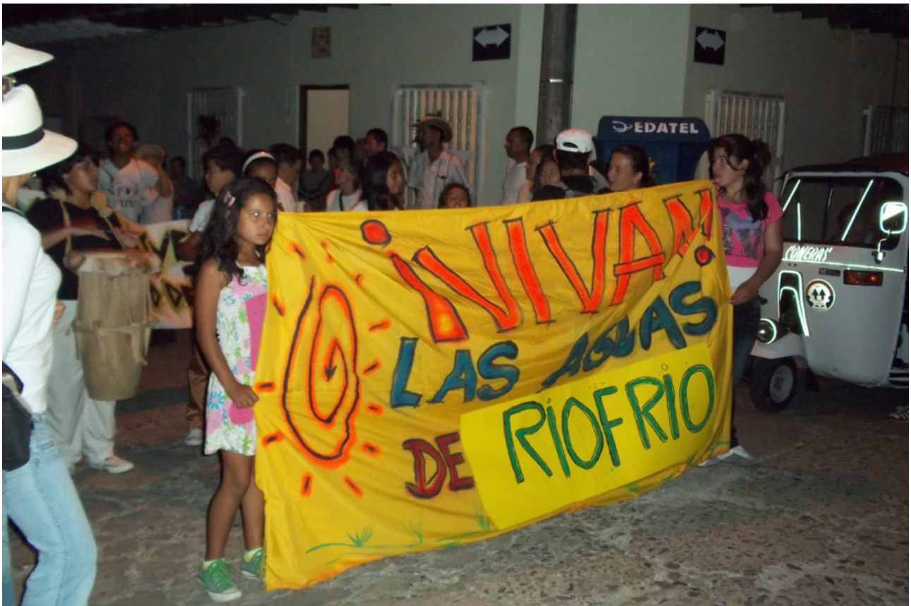
FOTO 1 – MOVILIZACIÓN EN DEFENSA DEL AGUA Y DEL TERRITORIO. TÁMESIS, ANTIOQUIA, COLOMBIA, 21 DE JULIO DE 2012

la convocación de voluntades para lograr un propósito común bajo una interpretación y un sentido compartidos, mediante una acción comunicativa que por ser una convocación es un acto de libertad, por ser una convocación de voluntades es un acto de pasión y por ser una convocación de voluntades a un propósito común es un acto público y de participación (Toro, 2001).