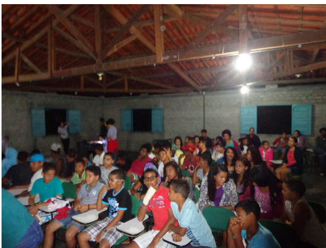
FIGURA 3 – O CCT NO MOMENTO DE SERÃO NA EFA-VALENTE: OPORTUNIDADE DE FORTALECIMENTO DAS APRENDIZAGENS.

Foto: João Paulo Silva, 09 de julho de 2015.