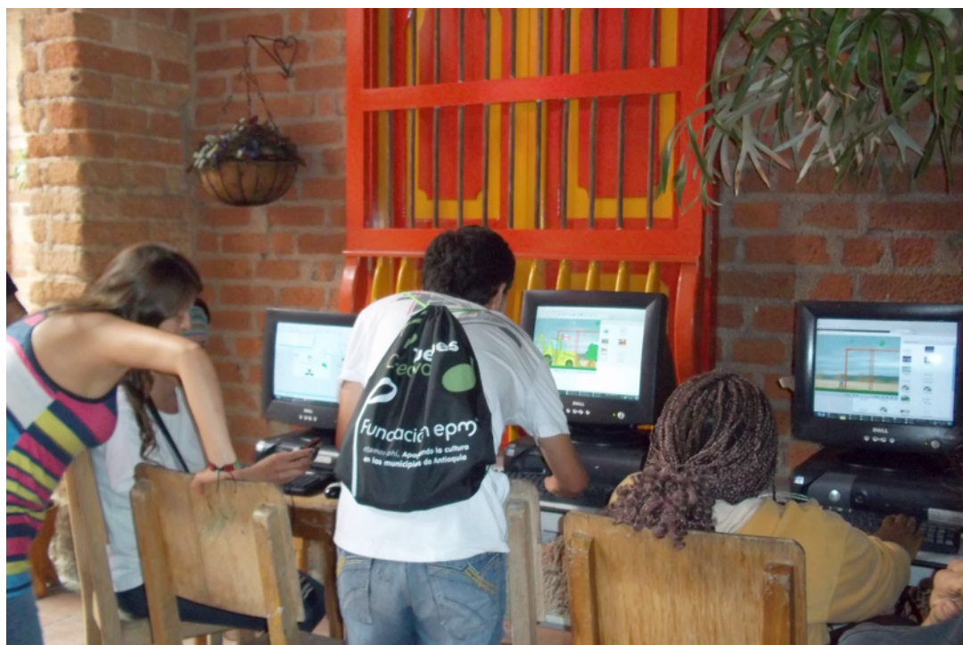
FOTO 2 – NIÑOS Y NIÑAS DESCUBRIENDO EL VIDEOJUEGO SOBRE LA MINERÍA

El videojuego fue una acción novedosa para muchos niños y niñas en los municipios del Suroeste Antioqueño. A través del juego ellos pudieron entender mejor el proyecto minero y sus implicaciones. Además, los niños fueron capaces de replicar ideas acerca de acciones que podrían poner en práctica. Uno de los diseñadores del juego (PI 17).