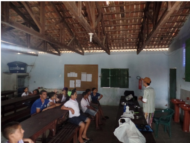
FIGURA 2 – O ENCONTRO COM O NOVO, NA NARRATIVA DE UMA ESTUDANTE DA EFA-VALENTE

Foto: João Paulo Silva, 09 de julho de 2015.