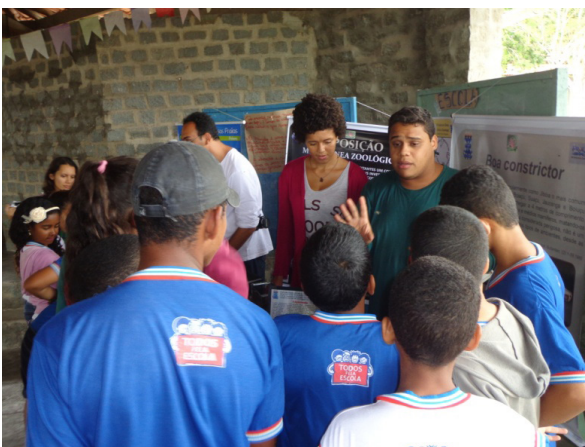
FIGURA 1 – MOMENTOS COMPARTILHAMENTO DE SABERES: NARRATIVAS DE PARTICIPANTES DO IV CCT 2

Fonte: João Paulo Silva 4 , 09 de julho de 2015.