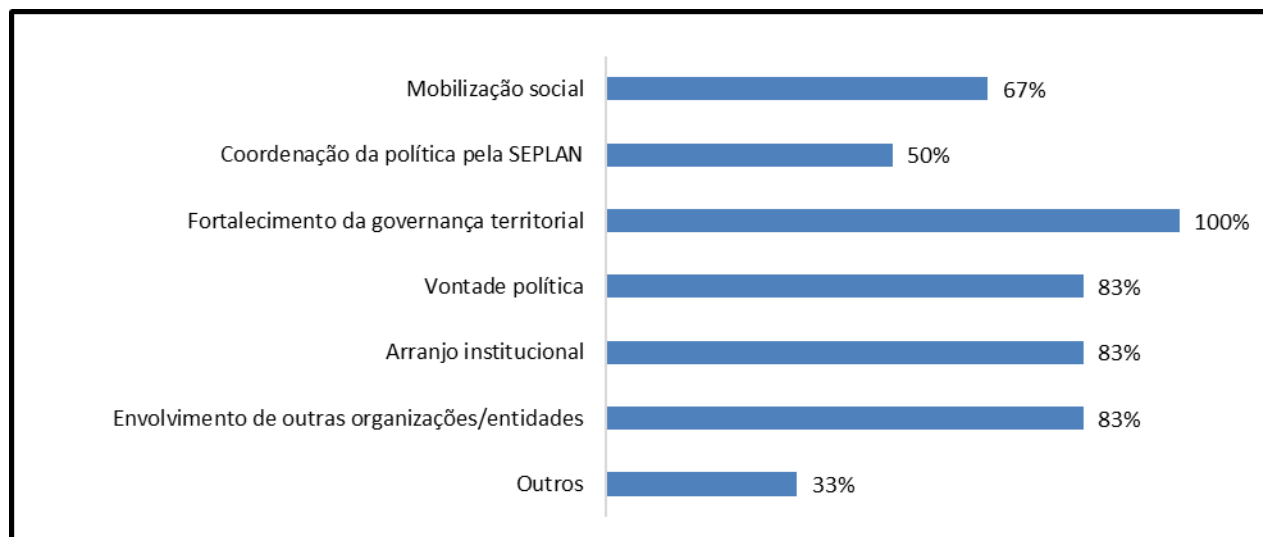
Figura 1 – Diferencial da política territorial do estado da Bahia

Para os coordenadores de CODETER (Figura 1), este arranjo institucional implementado pelo governo baiano se diferencia em relação ao concebido pelo governo federal, o que, segundo estes interlocutores, garantiu a longevidade da política territorial baiana. Para os entrevistados, esta estruturação foi possível graças ao interesse do governo estadual, que incentivou a mobilização de agentes públicos e civis para a implantação dessa abordagem de desenvolvimento, principalmente após o desmonte do MDA e das políticas nacionais de fomento à agricultura familiar.